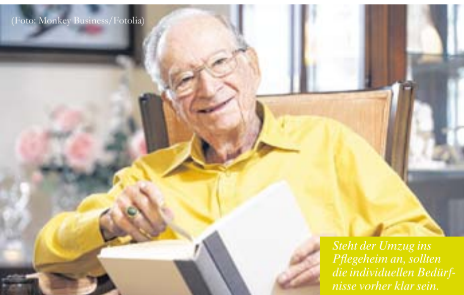
Steht der Umzug ins Pflegeheim an, sollten die individuellen Bedürfnisse vorher klar sein.