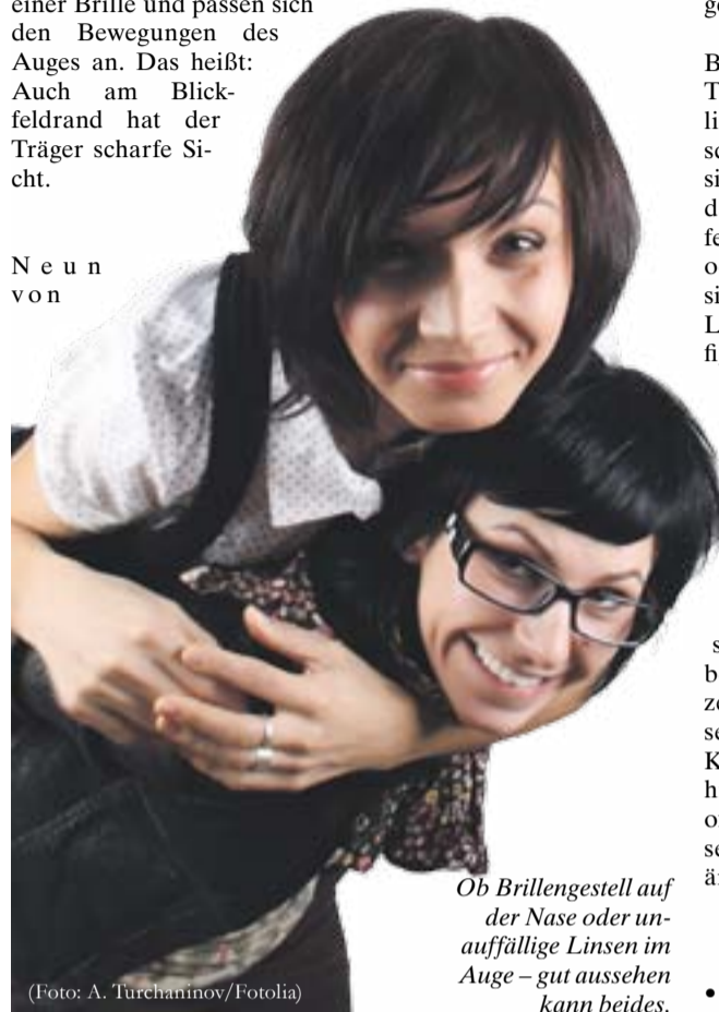
Ob Brillengestell auf der Nase oder unauffällige Linsen im Auge – gut aussehen kann beides.

zehn Menschen vertragen Kontaktlinsen ohne Probleme, so das Kuratorium Gutes Sehen (KGS). Auch Kinder und Jugendliche können welche tragen – vorausgesetzt sie beherrschen die Pflege und das Einsetzen selbstständig. Anders als bei Brillenträgern sind modische Sonnenbrillen